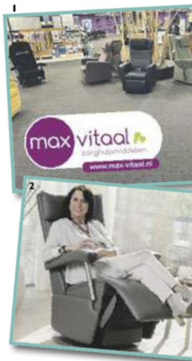
Foto 1: Verschillende uitvoeringen, stoffen en kleuren in de ruime showroom.

Traktieweg 12 8304 BA Emmeloord Telefoon 0527 - 860 086 info@max-vitaal.nl | Parkeerplaatsen aanwezig